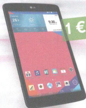
TABLET LG G PAD 8.0 LTE

Prdlíte si zmluvu s paušalom Happy Profi a novým akciovým tabletom. 4G smartfón od nás dostanete ako darček. Zistite viac na www.telekom.sk